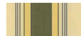
320 978 UV 60