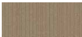
320 992 UV 80