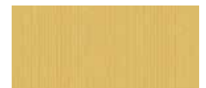
320 991 UV 80